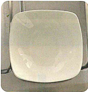
通常ライトの様子