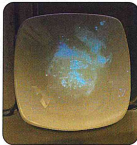
お皿や電気ポットをワープサーチで照らした状態