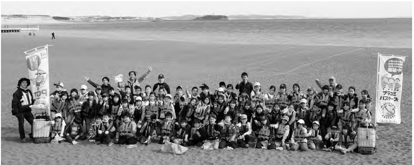
NPO法人海の森・山の森事務局 茅ヶ崎・サザンビーチでのプラスチックゴミ回収

したおサカナのおうち作り、景観の素晴らしい海岸でのウォーキングなどを通じて多くの人に海の大切さを理解してもらおう。