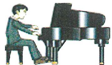
チャリティーコンサート

※ 入会ご希望の方、またご紹介頂ける方がいましたら、TEL:03-6240-9381 までご連絡ください。 ☆ e-mail 仲間に協会の URL= https://jarp.or.jp を知らせて、協会のHPを閲覧してもらおう！