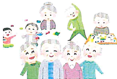
各種 社会貢献活動